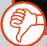
Standard-Schweißbrenner: Starke Rauchentwicklung!